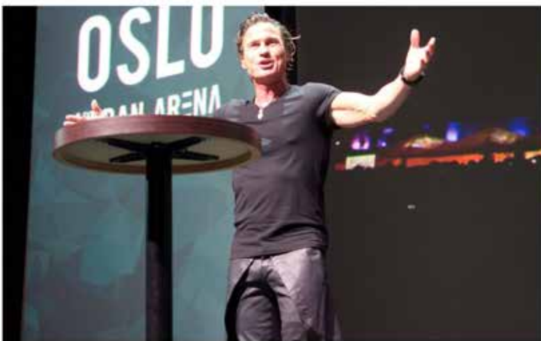
Petter Stordalen i storform.